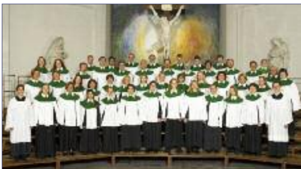
Hamburger Bachchor St. Petri