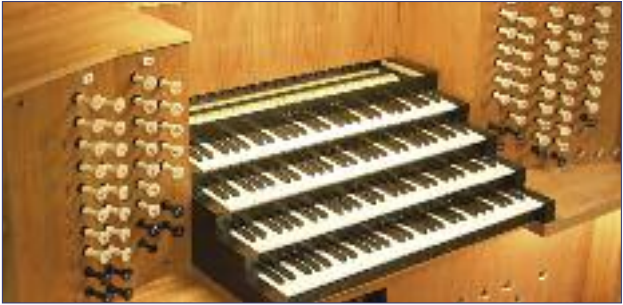
Spieltisch der großen Beckerath-Orgel

St. Petri besitzt drei ORGELN aus der Werkstatt von Rudolf von Beckerath. Die große Orgel gehört mit vier Manualen, 66 Registern und 4.724 Pfeifen zu den größten und klangschönsten Hamburgs. Sie erklingt neben den Gottesdiensten in der wöchentlichen Stunde der Kirchenmusik und in den sommerlichen internationalen Orgelkonzerten. Die Restaurierung und Erweiterung der Großen Orgel durch Fa. Alexander Schuke Orgelbau, Potsdam, wurde 2006 abgeschlossen. Die beiden kleineren Orgeln der Kirche wurden im Jahre 2007 und 2008 generalüberholt.