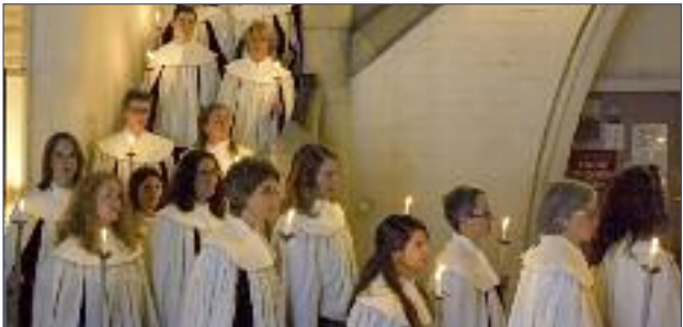
Einzug mit brennenden Kerzen

– Eine Veranstaltung der Gemeinschaft Hamburger Hauptkirchen –