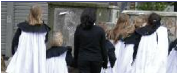
Kinderchor St. Petri

Die Kinderchorproben finden mittwochs von 15.30 Uhr bis 16.15 Uhr (Zimbelsternchen, ab 4 Jahren), mittwochs 16.30 Uhr bis 17.15 Uhr (Kinderchor, 1. und 2. Klasse) im Gemeindehaus, Bei der Petrikirche 3, und donnerstags, 16.30 Uhr bis 17.45 Uhr (Currende, ab 3. Klasse) im Bachsaal (Kirche) statt.