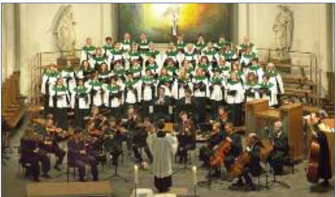
Bachkantate in St. Petri