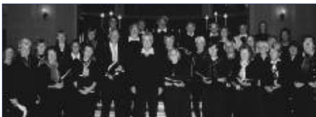
Collegium vocale St. Petri

Die Chorproben finden dienstags von 19.45 Uhr bis 22.00 Uhr im Gemeindehaus, Bei der Petrikirche 3, statt.