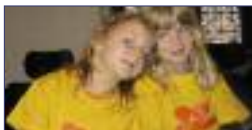
Kinderchor St. Petri