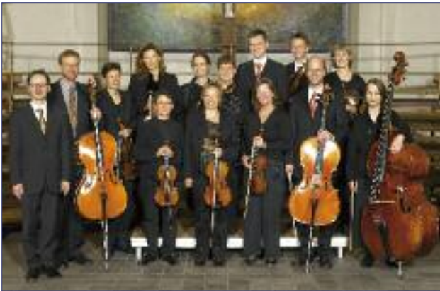
Collegium musicum St. Petri

Die Orchesterproben finden nach Absprache mittwochs von 20.00 Uhr bis 22.00 Uhr im Gemeindehaus, Bei der Petrikerche 3, statt.