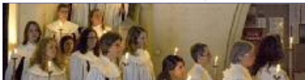
Einzug mit brennenden Kerzen

Der Einzug der Sängern und Sänger in ihren Chorgewändern zur sonntäglichen Messe, der Gesang des gregorianischen Introituspsalms und die Aufführung von Motetten und Kantaten machen die Gottesdienste in St. Petri zu einem besonderen Erlebnis. Zu den Höhepunkten im Kirchenjahr zählen die Feier der Osternacht, die Christvesper mit Quempassingen oder die St. Ansgarvesper, die seit über vierzig Jahren von drei Chören unterschiedlicher Konfessionen ausgestaltet wird. Der Chor unternimmt regelmäßig Konzertreisen ins Ausland. Unter anderem ist er in Frankreich, England, Nord- und Südamerika, Japan und Ägypten aufgetreten. Interessenten an einer Chormitgliedschaft sollten über Notenkenntnisse und Chorerfahrung verfügen. Die Aufnahme erfolgt nach bestandenem Vorsingen. Die Chorproben finden donnerstags von 19.30 Uhr bis 22.00 Uhr im Gemeindehaus, Bei der Petrikirche 3, statt.