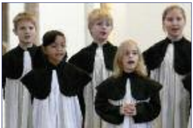
Kinderchor St. Petri im Gottesdienst