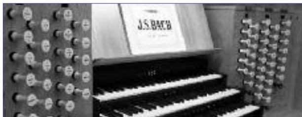
Spieltisch der großen Beckerath-Organ